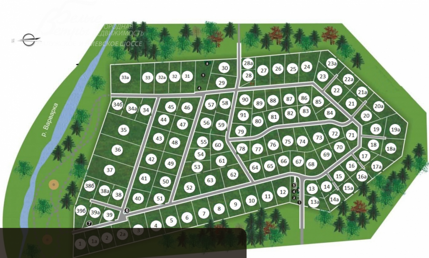
СХЕМА КОТТЕДЖНОГО ПОСЕЛКА «ПРЕЗИДЕНТ»